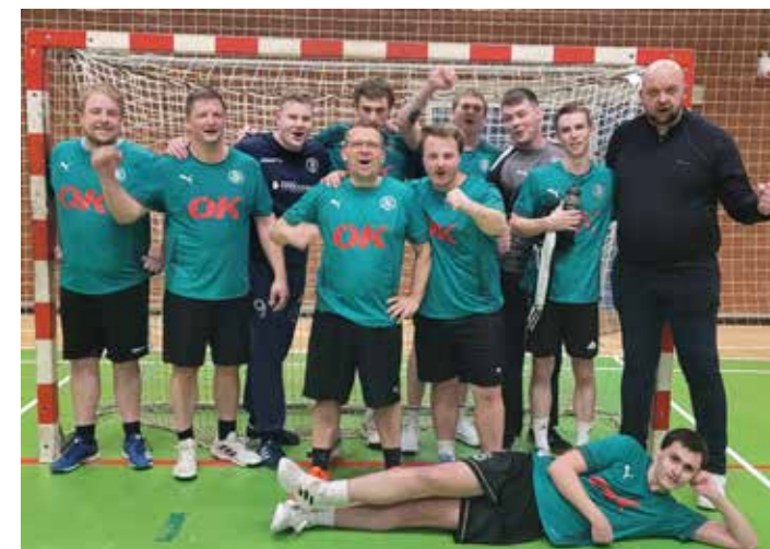
Senior Herrer - Holdbillede efter sejren i Langeskov

I forbindelse med årets generalforsamling skal vi finde en ny formand og kasserer, så håndbolden også fremover kan leve og udvikle sig i Bøgeskovhallen. Jeg lover personligt at hjælpe en ny formand godt i gang, og der er også mulighed for at gøre kassererposten lidt mere "light", hvis det er det, der er behov for.